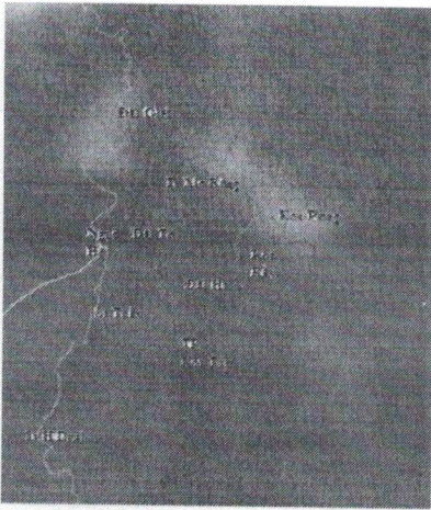
Ảnh vệ tinh